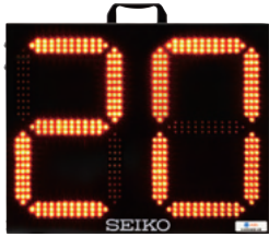
表示盤 BT-501DP ¥269,500(本体価格:¥245,000)