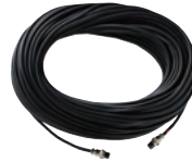
信号ケーブル(50m) BT-501CA50 ¥22,000(本体価格:¥20,000) ※信号ケーブル80mもございます。 ご希望の場合お問い合わせください。