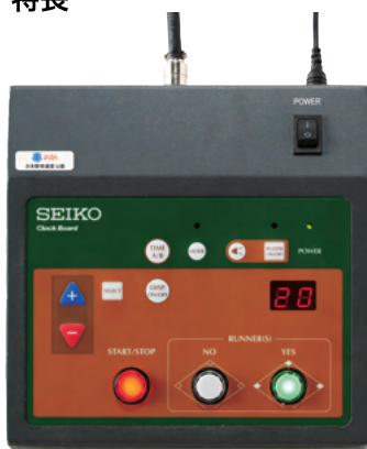
直観的で操作しやすい操作盤デザイン