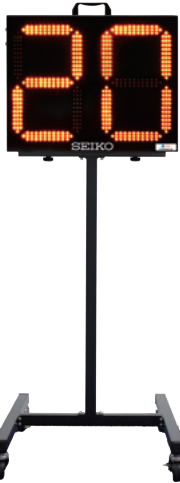
スタンド BT-011 ¥85,800(本体価格:¥78,000)