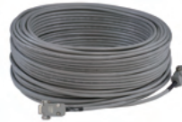
連動ケーブル(80m) KT-041 ¥35,200(本体価格:¥32,000)