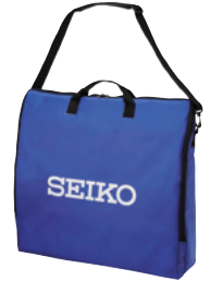
キャリングバッグ BT-032 ¥18,700(本体価格:¥17,000)